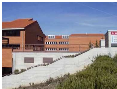
Facultad de Bellas Artes.

Representantes de la Asociación Cuenca Abstracta 2016 visitaron el jueves la Facultad de Bellas Artes de Cuenca para conocer de primera mano las Colecciones y Archivos de Arte Contemporáneo de Cuenca (CAAC).