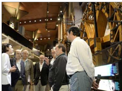
Imágenes de la visita de la consejera a la ciudad de Cuenca.