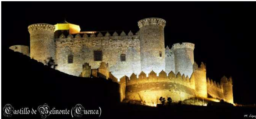
Castillo de Belmonte (Cuenca)